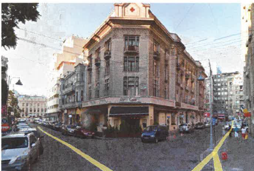
Figura 2: Fațadă colț Str. Mendeleev cu Str. Biserica Amzei