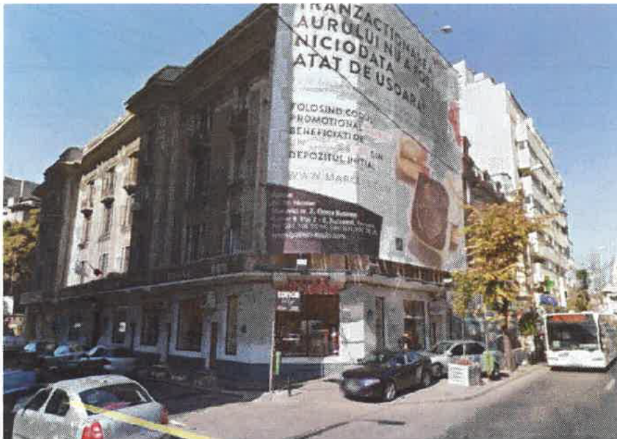
Figura 4: Fațadă colț Bd. Magheru cu Str. Biserica Amzei