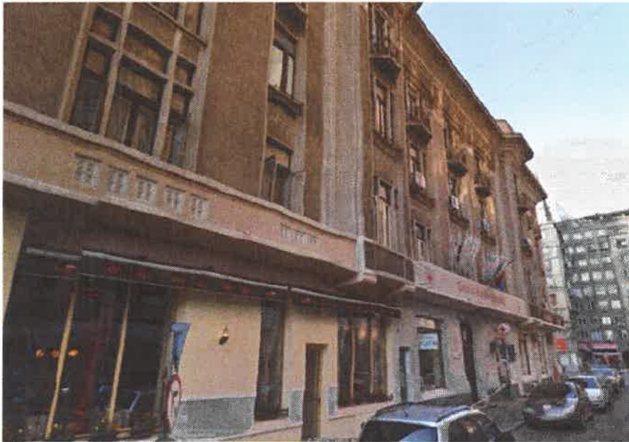
Figura 3: Fațadă pe Str. Biserica Amzei